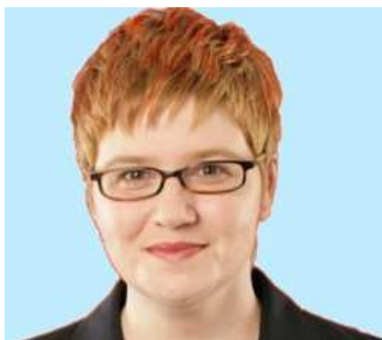
Anette Kramme, MdB

das allgegenwärtige Schreckgespenst Arbeitsplatzverlust geht derzeit wieder um. Die Rosenthal AG plant in den Werken Selb und Speichersdorf einen massiven Stellenabbau, die Telekom will 50000 Arbeitsplätze in eine Servicegesellschaft auslagern, was im Endeffekt längere Arbeitszeiten bei deutlich geringerem Gehalt bedeutet. Der Bundespolizeistandort Bayreuth bleibt dagegen erhalten. Ich bin außerordentlich froh, dass die harte Arbeit der SPD hier einen Erfolg für die Region erbringen konnte.